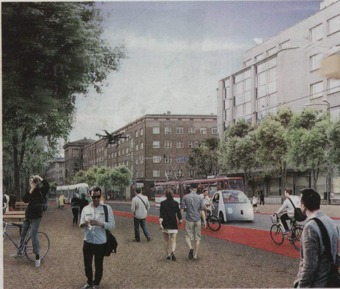
Esimesena peaks uue peatänav loomine muutma vabariigi juubeliks Narva ja Pärnu maantee sädalinnapoolsed otsad senisest enam jalakäija-, ratturi- ja ühistranspordisõbralikuks.

«Kui aastakümneid tagasi soovisid Põhjamaad aasta läbi avatud ja jalakäijate sõbraliku linnaga algust teha, oli vastuväiteid palju,» rääkis Westermarki arhitektuuribüroost Gehl Architects. «Kliima pole see, poed surevad välja ja üleüldse, see pole meie kultuurile omane. Aga elu näitab, et inimesed