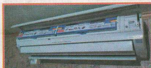
Õhksoojustpumpade keemiline pesu