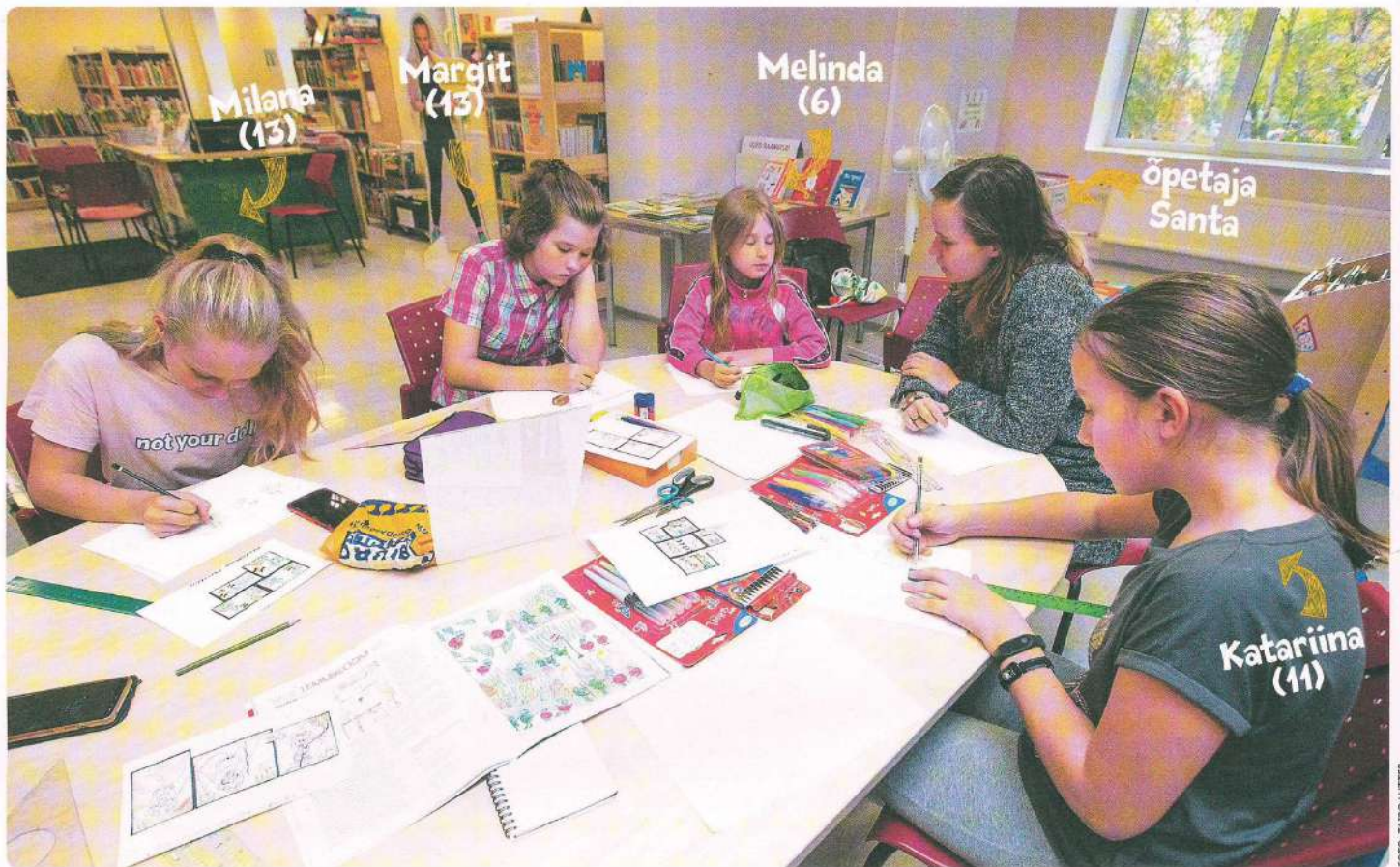
Koomiksiringis saab õppida, kuidas piltide abil lugu jutustada.

Tekst: Adele Johanson