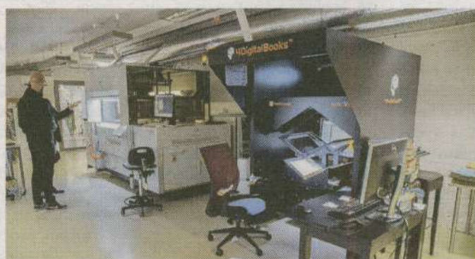
Selliste seadmetega digiteeritakse vanu raamatuid ja ajalehti.

Kui rääkida muutustest, mida eriolukord tõi kaasa, siis näiteks muuseumid hakkasid tegema virtuaalnäitusi. Seni on see olnud marginaalne tee-