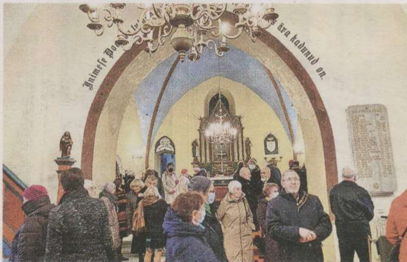
Eakate päevakeskuse ekskursioon Kuusalu kirikus.