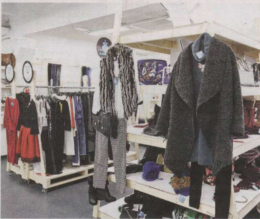
Uuskasutuskeskus Sõpruse puistee 255.

Kogumisringi ajal palub Uuskasut-uskeskus mitte tuua ka mööblit, et autosse kõik kenasti ära mahuks. Kor-